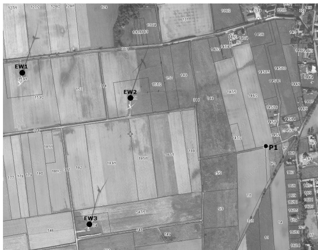
Rys. 1. Lokalizacja punktu pomiarowego Fig. 1. View of the measurement point

Pomiary wykonano, z osłoną przeciwwietrzną przenośnym, analizatorem dźwięku i drgań SVAN 912 AE przeznaczonym do pomiaru i analizy sygnałów w paśmie 0,8 Hz - 25,6 kHz. Przyrząd może pracować w warunkach połowych wykorzystując wewnętrzne źródło zasilania. W zależności od wybranego trybu pracy, może on pełnić funkcję miernika poziomu dźwięku lub funkcję miernika drgań (klasa "1" wg norm obowiązujących dla pomiaru dźwięku i drgań) oraz wąskopasmowego lub tercjowo-oktawowego analizatora sygnałów.